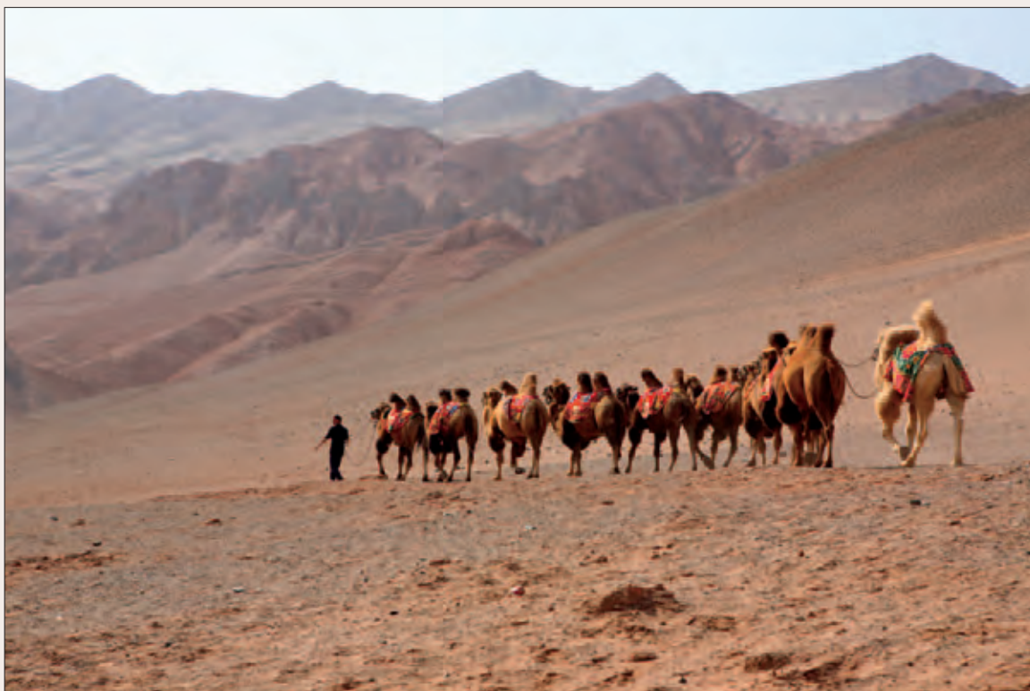
Рис. 2. Караван в пустыне Такла-Макан. Фото Т. М. Федоровой. Экспедиция МАЭ РАН, 2008 г.