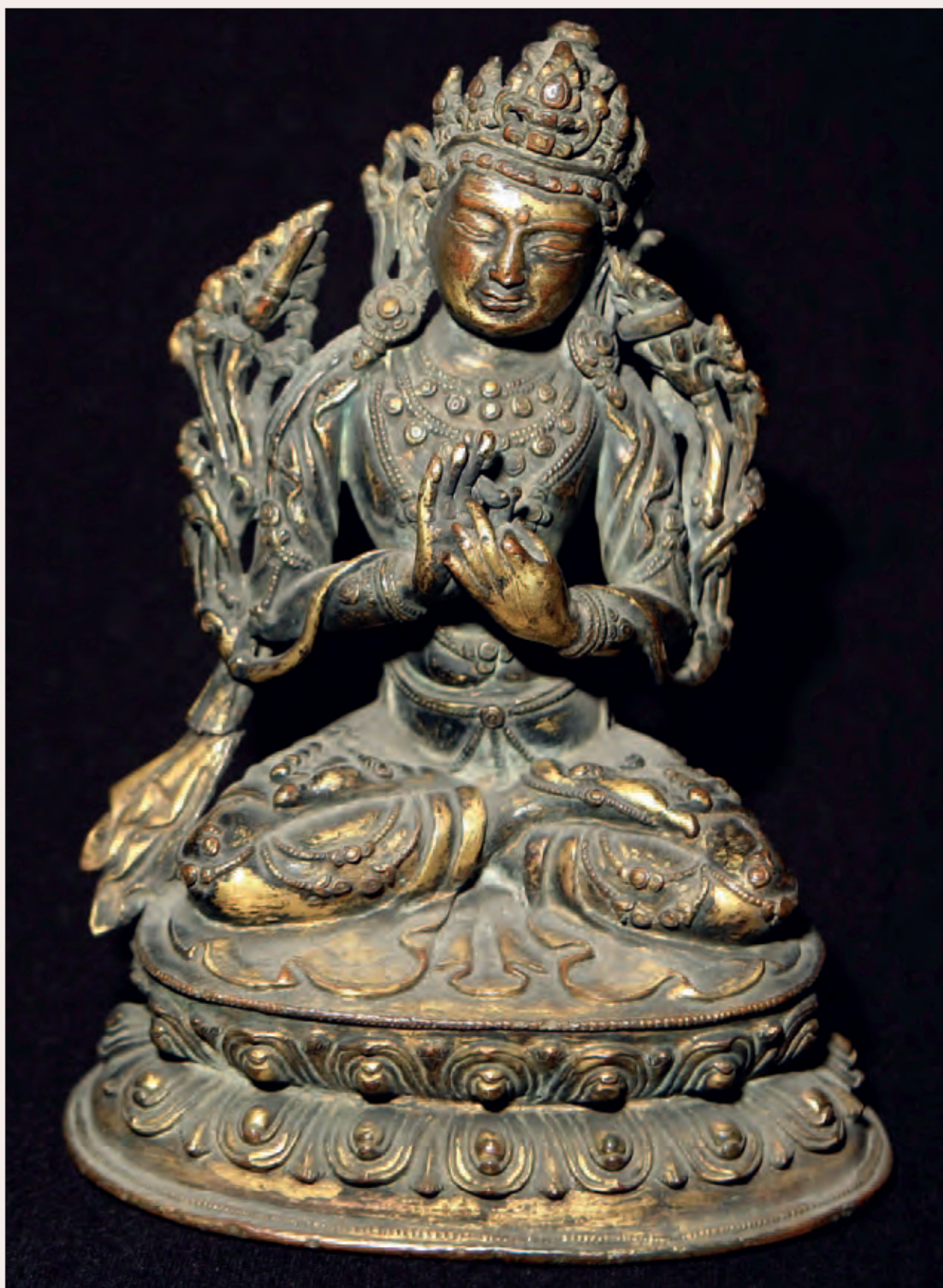
Рис. 5. Статуэтка Манджушри. Высота 17,0 см. Бронза. Дар С. Н. Алфераки, 1899 г. МАЭ РАН, № 455-1.