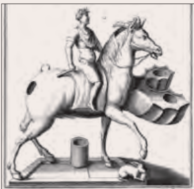
Рис. 6. Изображение бронзового светильника в виде всадника (римского императора) из коллекции И. М. Лихарева (Montfaucon. Supplement ). IV в. Приобретено, в начале XVIII в. на Рудном Алтае