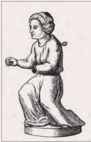
Рис. 4. Изображение бронзовой статуэтки человека в длиннополой одежде из коллекции И. М. Лихарева (Montfaucon. Supplement ). Западная Европа, развитое Средневековье (сер. XI – перв. пол. XV в.). Приобретено в начале XVIII в. на Рудном Алтае (ср.: Борисенко, Худяков. «Западно-европейский акваманил». С. 128)