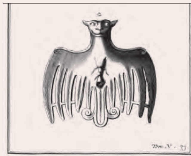
Рис. 10. Изображение бронзового акваманила в виде сидящей птицы со сложенными крыльями из коллекции И. М. Лихарева (Montfaucon. Supplement ) (ср. Аблай-китская статуэтка, изображающая птицу, своей позой, пропорциями и манерой изображения перьев, сложенных крыльев и хвоста имеет черты сходства с найденной в Суздале бронзовой дарохранительницей в виде голубя, изготовленной во Франции в XIII в. (В. П. Даркевич. «Произведения западного художественного ремесла в Восточной Европе X–XIV вв.». Свод археологических источников (М., 1966). С. 27; Борисенко, Худяков. «Коллекция находок». С. 130). Приобретено в начале XVIII в. на Рудном Алтае

обратиться к французским ученым, а не к куда более квалифицированным знатокам монгольского, ойратского или тибетского языков, жившим в России 15 .