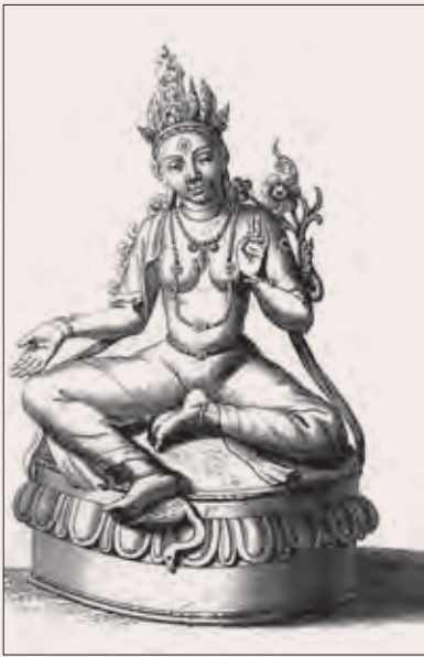
Рис. 3. Изображение бронзовой статуэтки буддийской богини Зеленая Тара из коллекции И. М. Лихарева (Montfaucon. Supplement ). Из развалин монастыря Аблай-кит, XVII в. (?)