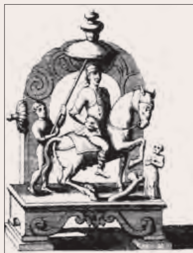
Рис. 7. Изображение скульптурной группы из всадника, ребенка и священника, выполненной в греко-буддийском стиле, из коллекции И. М. Лихарева (Montfaucon. Supplement ). V–VI вв. (см.: Княжецкая. «Новые сведения». С. 30–32). Приобретено в начале XVIII в. на Рудном Алтае