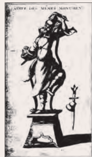
Рис. 8. Изображение даосского святого из коллекции И. М. Лихарева (Montfaucon. Supplement ). Китай, VIII–IX вв. (см.: Княжецкая. «Новые сведения». С. 30–32). Приобретено в начале XVIII в. на Рудном Алтае