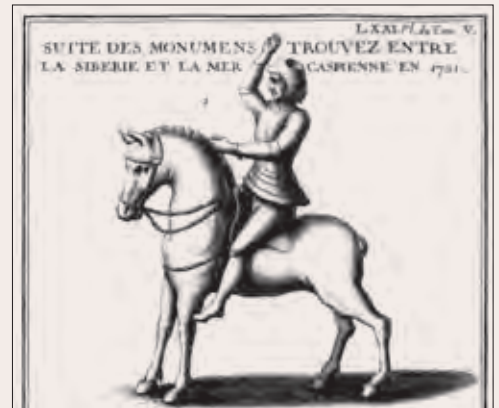
Рис. 5. Изображение бронзового акваманила — сосуда для омовения рук в виде конного рыцаря — из коллекции И. М. Лихарева (Montfaucon. Supplement ). Западная Европа, XIV в. (?). Приобретено в начале XVIII в. на Рудном Алтае (Борисенко, Худяков. «Предметы торевтики». С. 33–34)